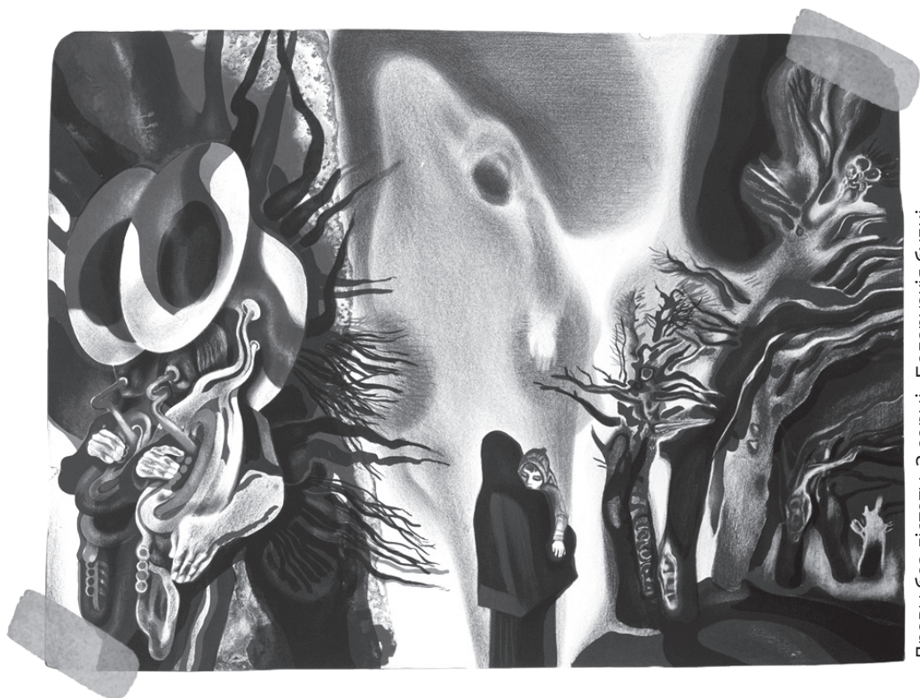
Дрэвы без лістоты. 3 серыі «Беларускія будні»

доўнаму куточку беларускай зямлі. Яшчэ ў сярэдзіне 1970-х Георгій з жонкай Наталляй, таксама таленавітай мастачкай, набылі менавіта там, побач з вёскай Маскавічы, на хутарку Рацыоны, старэнькі драўляны дамок. Побач — сляды старадаўняга гарадзішча вікінгаў XI—XII ст., чароўная «палітра» азёр, уключаючы Недрава, Дзярба, Неспіш і інш. Гэта за некалькі кіламетраў ад вёскі Слабодка, дзе вось ужо шмат гадоў я кожнае лета ў сваім цудоўным доміку, амаль на беразе возера Поцех, баўлю час. Неаднойчы тут сустрэкаліся з Жорам Паплаўскім. Зразумела, за «круглым сталом», але на прыродзе.