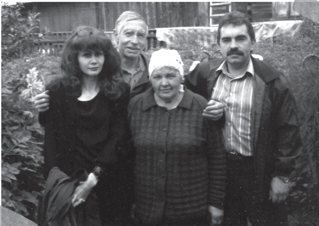
З бацькамі і жонкай на родным падворку. Другая палова 90-х

У хаце прыцемак. Сонца Зламала свой промень аб пажайцелую занавеску, і яго кавалак упаў на падлогу. Зажмурыўся павук і папоўз у цёмны кут.